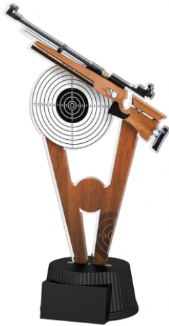
2. Platz (26 cm)

Preise: Da der SV Kamen im Jahre 2020 sein 200-Jähriges Jubiläum feiert werden 3 Besitzpokale ausgegeben.