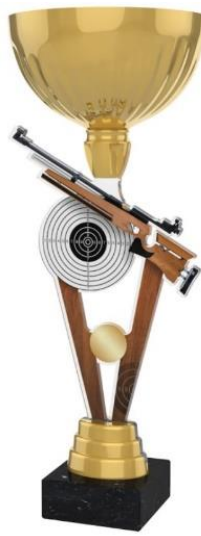
1. Platz (37 cm) 37 cm Gefüllt mit 200 1 € Münzen