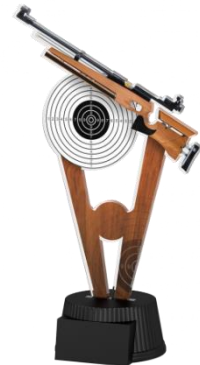
3. Platz (19 cm)

Anmeldung per E-Mail sv-kamen1820@t-online.de Homepage Anmeldung